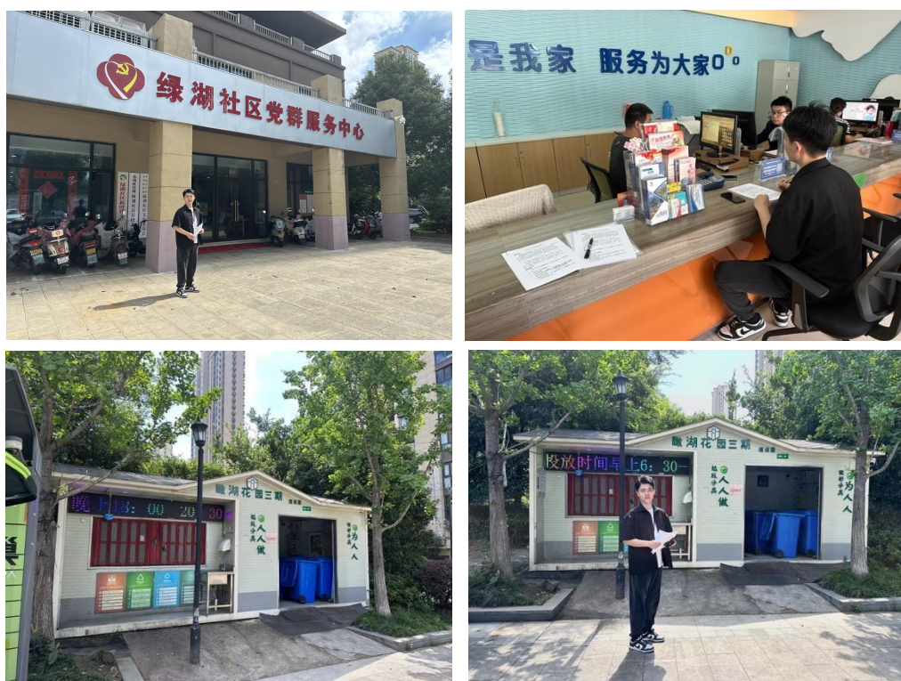
图 1 绿湖社区现场调研照片

评分标准表的打分，在现有条件下，社区内部分“无废”政策和设施并未建立，本调研针对评分表中的此内容进行了可行性分析，确保在“无废社区”建设过程中具备执行的可行性和合理性。现场调研照片如图 1 所示。具体评分细则如表 1 所示。